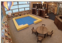
ライブラリー ほんとわ