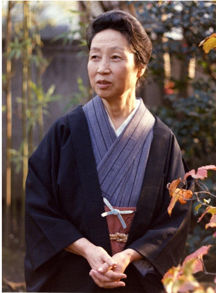
昭和 54 年 12 月、自宅庭にて

本展広報に関するお問い合わせ先 世田谷文学館学芸部学芸課 担当：庭山・瀬川 〒157-0062 東京都世田谷区南烏山 1-10-10 TEL：03-5374-9111