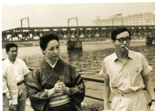
映画『おとうと』撮影現場の幸田文と監督の市川崑