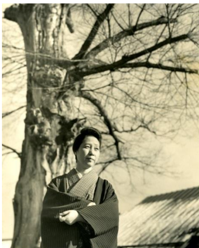
昭和 31 年 1 月、小石川の家の前で

文名の高まるなか、「私が文章を書く努力は私としては最高のものではなかった」「努力しないで生きてゆくことは幸田の家としてもない生き方」と、断筆を宣言して柳橋の芸者置屋に住み込みで働き、その経験をもとに長編小説『流れる』を発表、作家としての地位を確立する。本章では『黒い裾』『おとうと』『北愁』など自伝的要素の強いフィクションも紹介し、執筆の幅を広げてゆく昭和 20 年代から 30 年代にかけての文の姿をたどる。