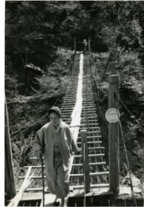
「婦人公論」昭和34年6月号 静岡県千頭国有林にて