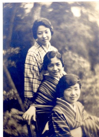
女子学院のころ 左より文、同級生、その姉

本章では、文の生いたちと共に、父・露伴の兄弟姉妹に実業家、探検家、音楽家、歴史学者を輩出した「幸田家の人びと」についても紹介する。