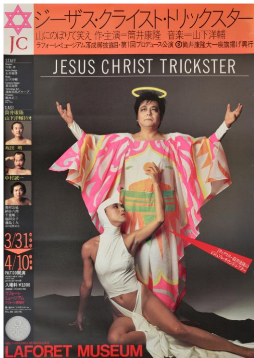
9.「筒井康隆大一座」公演『ジーザス・クライスト・トリックスター』チラシ