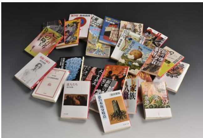
10.筒井康隆作品の数々