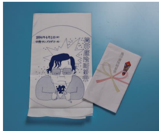
11.「筒井康隆断筆祭」記念の手ぬぐい 1994年 デザイン:和田誠