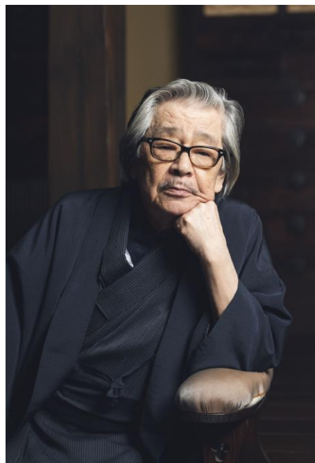
3. 筒井康隆

1934年大阪市生まれ。1960年SF同人誌「NULL」を発刊し、江戸川乱歩に認められて作家活動を開始する。81年『虚人たち』で泉鏡花賞、87年『夢の木坂分岐点』で谷崎潤一郎賞、89年『ヨッパ谷への降下』で川端康成文学賞、92年『朝のガスパール』で日本SF大賞、2010年菊池寛賞、17年『モナドの領域』で毎日芸術賞を受賞。02年に紫綬褒章を受章。主な作品に『時をかける少女』『家族八景』『大いなる助走』『虚航船団』『残像に口紅を』『文学部唯野教授』『聖痕』など多数。舞台・テレビ出演など幅広く活躍中。