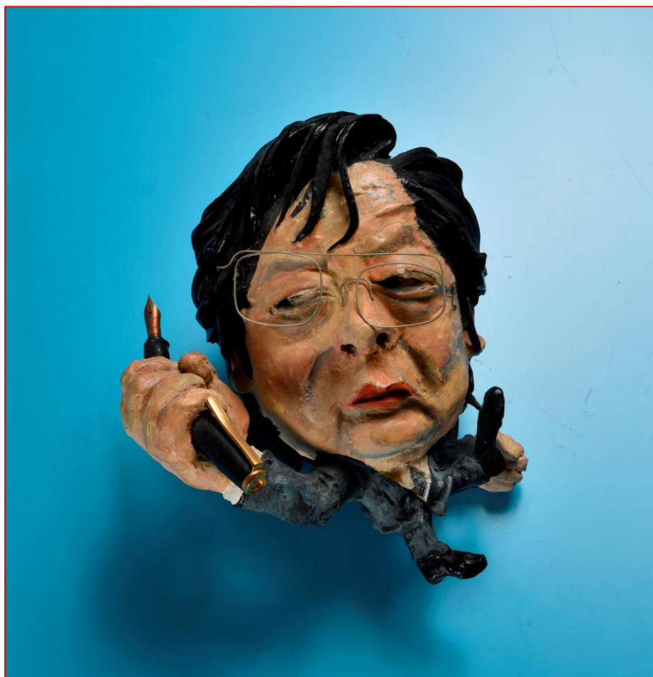
1. 「断筆宣言」記念人形 1993年