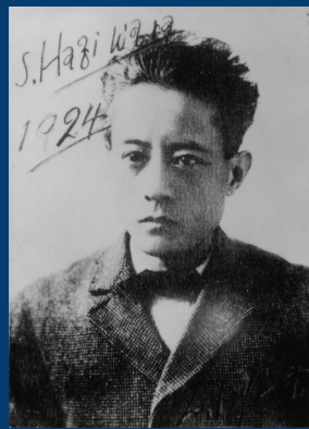
하기와라 사쿠타로 초상사진