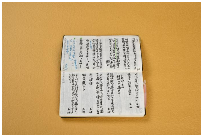
画像5 『父と暮せば』書き抜き帳 個人蔵