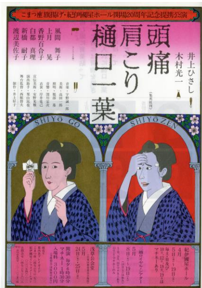
画像3 こまつ座旗揚げ公演チラシ 「頭痛肩こり樋口一葉」 仙台文学館蔵