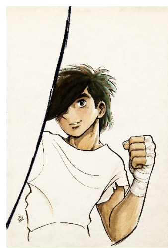
画像 15 ©高森朝雄・ちばてつや/講談社