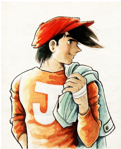
画像 13 ©高森朝雄・ちばてつや/講談社