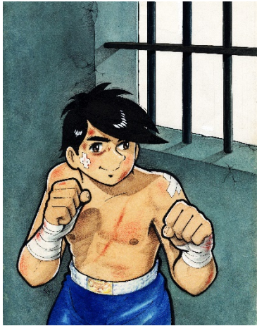
画像 10 ©高森朝雄・ちばてつや/講談社