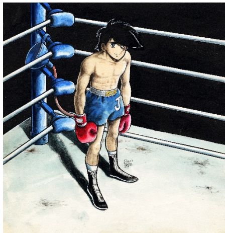
画像 11 ©高森朝雄・ちばてつや/講談社