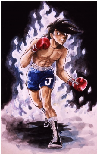
画像1 ©高森朝雄・ちばてつや/講談社