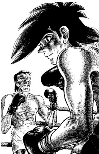
画像 16 ©高森朝雄・ちばてつや/講談社