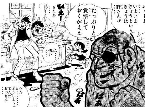
画像7 ©高森朝雄・ちばてつや/講談社