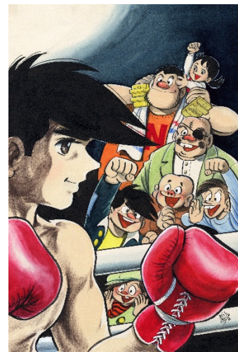
画像6 ©高森朝雄・ちばてつや/講談社