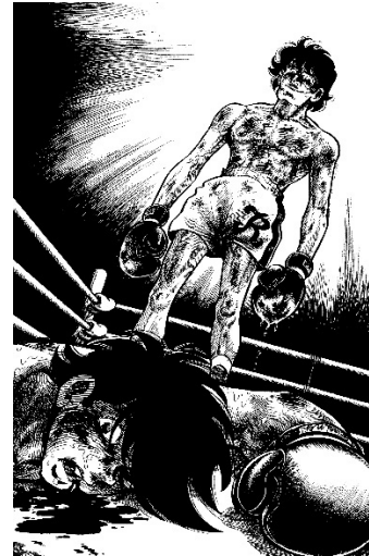
画像3 ©高森朝雄・ちばてつや/講談社