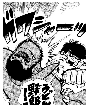
画像8 ©高森朝雄・ちばてつや/講談社