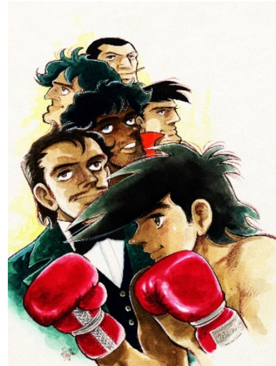
画像 18 ©高森朝雄・ちばてつや/講談社