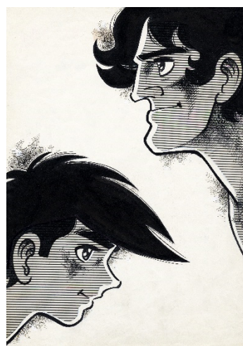
画像5 ©高森朝雄・ちばてつや/講談社