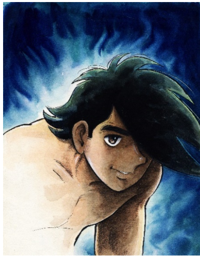
画像 14 ©高森朝雄・ちばてつや/講談社