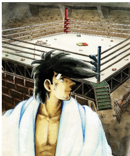
画像 17 ©高森朝雄・ちばてつや/講談社