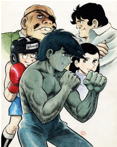
画像4 ©高森朝雄・ちばてつや/講談社