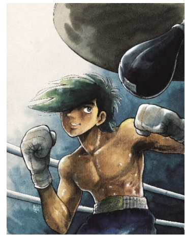
画像 12 ©高森朝雄・ちばてつや/講談社