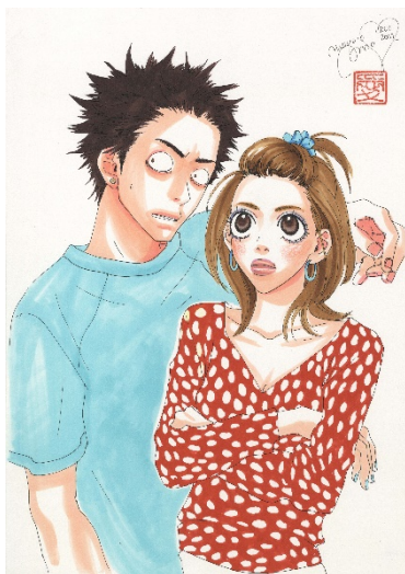
画像 3 花とみつばち