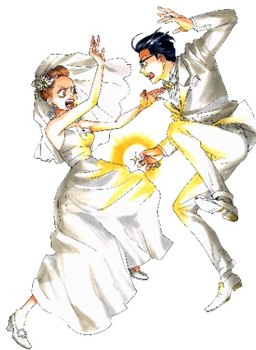
画像 2 後ハッピーマニア