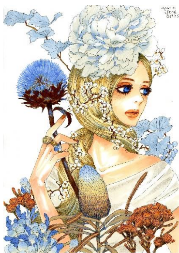
画像 13 遊澤龍彦『バビロンの架空園』装画