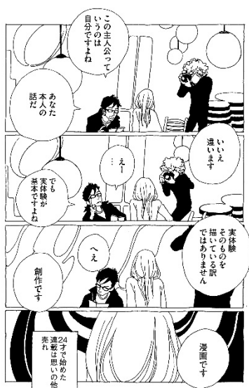
画像 12 よみよま