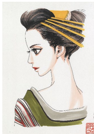
画像 6 さくらん