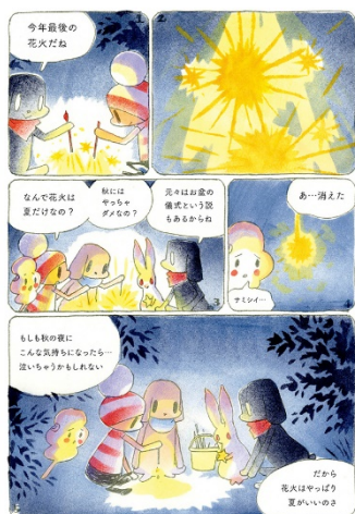
画像 10 オチビサン