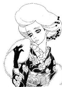
画像 14 2017年 年賀状イラスト