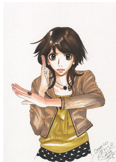
画像 9 働きマン