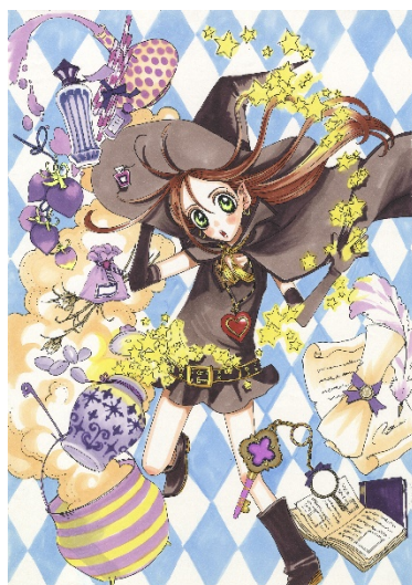
画像 8 シュガシュガールーン