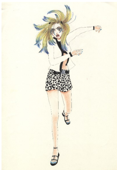
画像 1 ハッピー・マニア