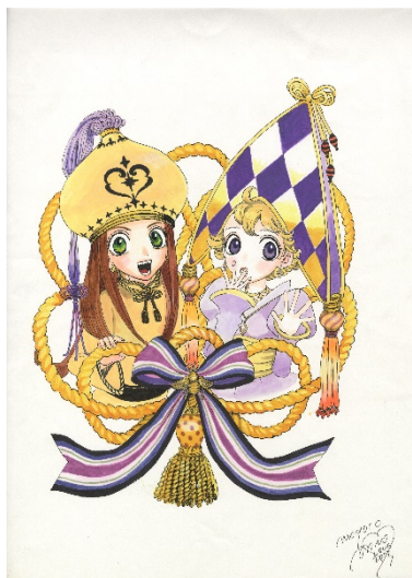
画像 7 シュガシュガールーン