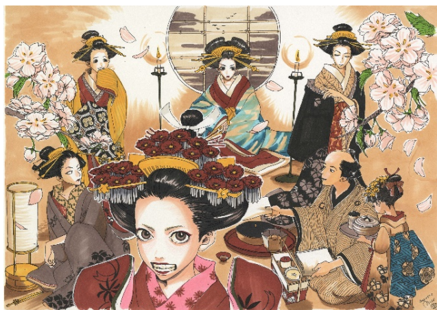
画像 5 さくらん