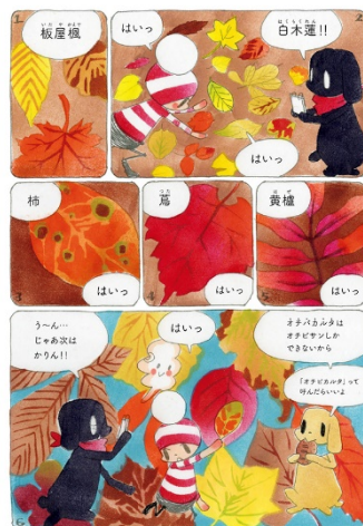
画像 11 オチビサン