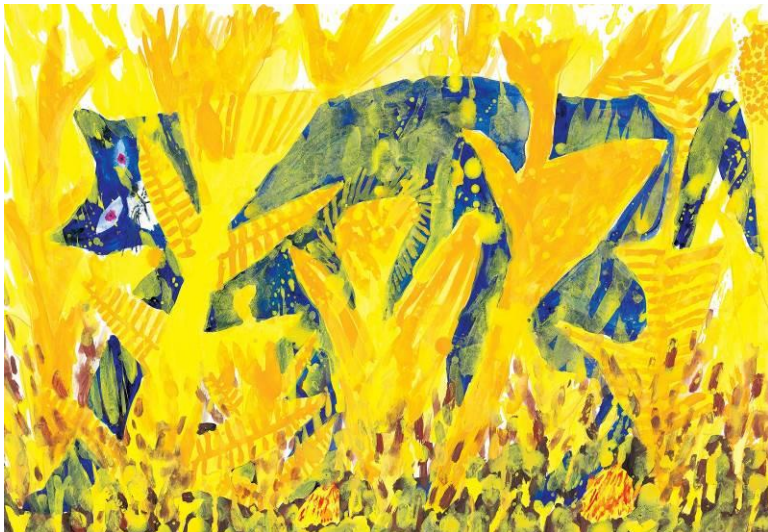
画像5 『オレときいろ』(絵本原画)2014年