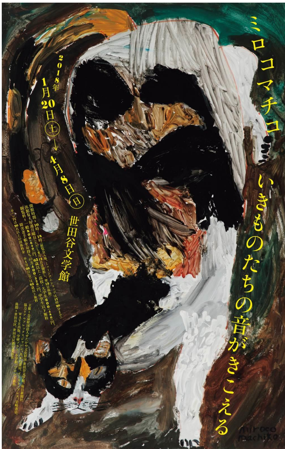
画像1 ポスターイメージ