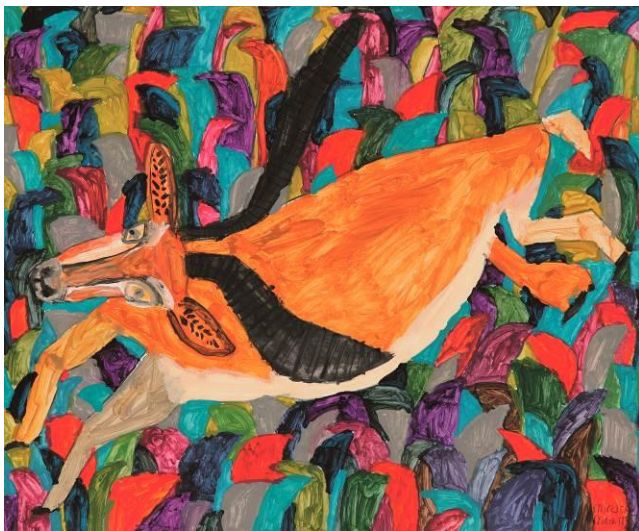
画像6 《グランドガゼルもまってる》2010年