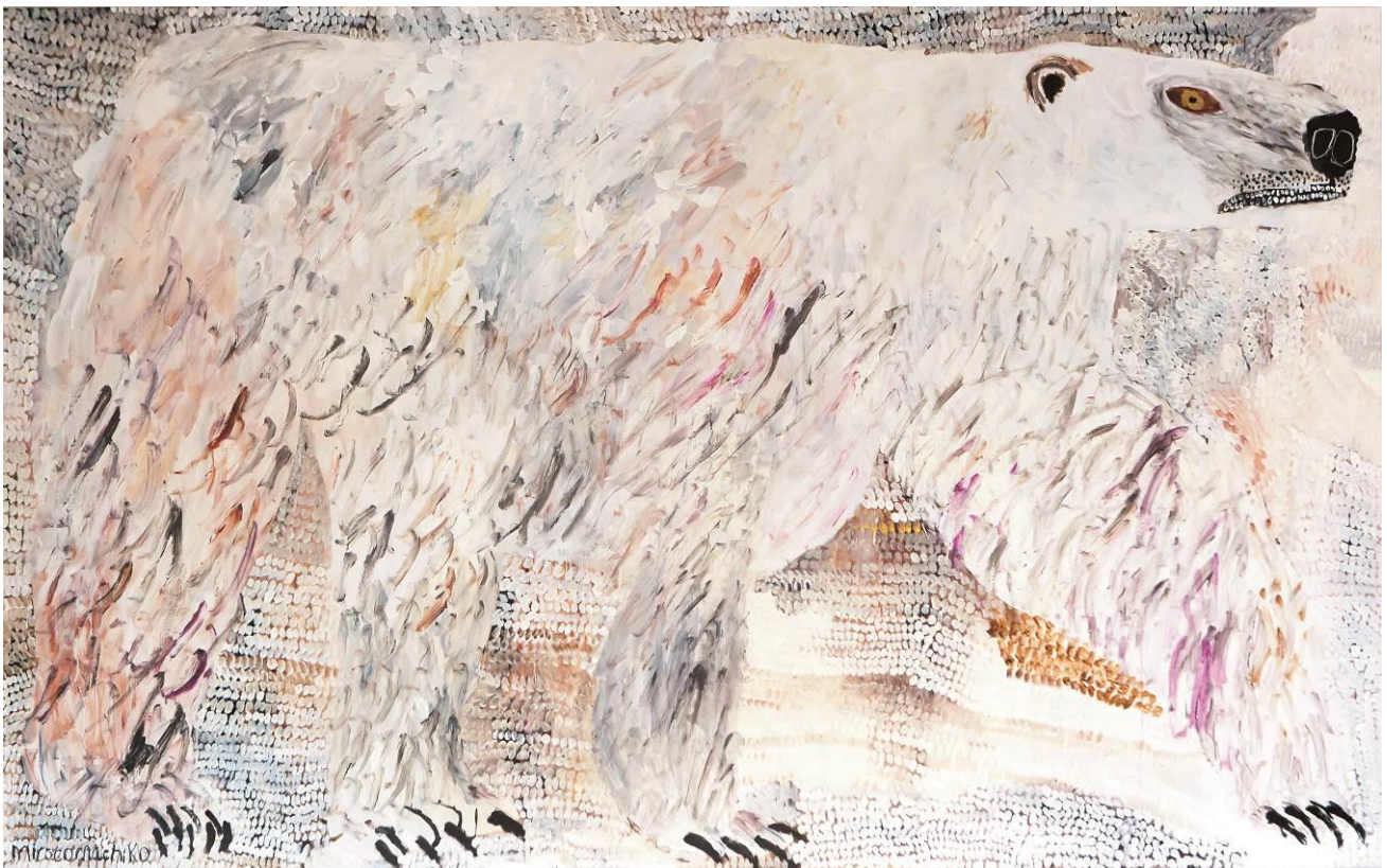
画像3 《ホッキョクグマ》2015年、アルフレックスジャパン蔵