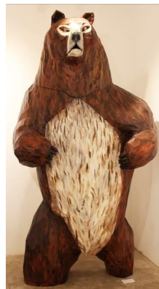
参考画像 左/《ヘラジカの森》(部分) 2014年 右/《クマ》(伊勢丹クリスマスキャンペーン) 2014年