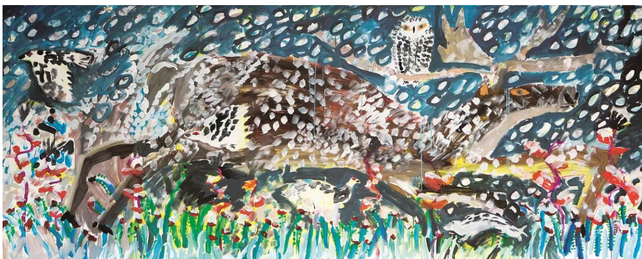
画像2 《おやすみ、トナカイ》2015年、ライブペイント、アルフレックスジャパン蔵

本展では、大型作品を含む絵画や立体、代表作の絵本原画など、150点以上の作品に最新作を加えて構成し、画家として、絵本作家として、日々創作をつづけるミロコマチコの、“今”を切り取ります。ダイナミックな、ライブ感あふれる展示をお楽しみください。