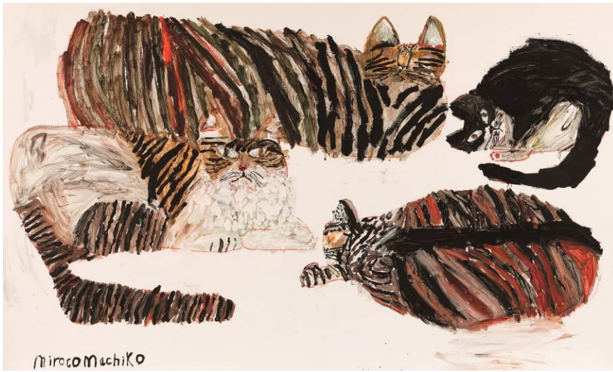
画像4 《ご飯を待つ4匹》2016年