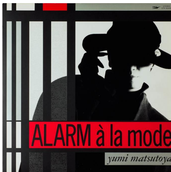
3 松任谷由実「ALARM a la mode」 (ユニバーサルミュージック/1986年) AD: 信藤三雄 D: Tetsuya K.B、中嶋佐和子 Ph: 川島文行