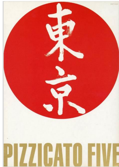
2 ピチカート・ファイヴ「さ・え・ら ジャパン」 (レディメイド・レコーズ、トーキョー/ヒートウェーブ/2001年) AD: 信藤三雄 D: 大石裕子

松任谷由実、ピチカート・ファイヴ、Mr.Children、MISIAなど、日本の音楽シーンをリードしてきた数多くのミュージシャンのCDジャケットを手がけ、新鮮なヴィジュアルイメージと革新的なプロダクトを生み出してきた アートディレクター、信藤三雄 (1948～)。写真家、映像ディレクター、書家、音楽家としても才能を発揮し、その作品は各方面のクリエイターにも影響を与え続けています。本展では80年代の初期作から最新の仕事に至るまで、時代とともにあり続けたアートワークの数々 1,000点以上を展覧 し、信藤三雄のクリエイティビティの全貌に迫ります。