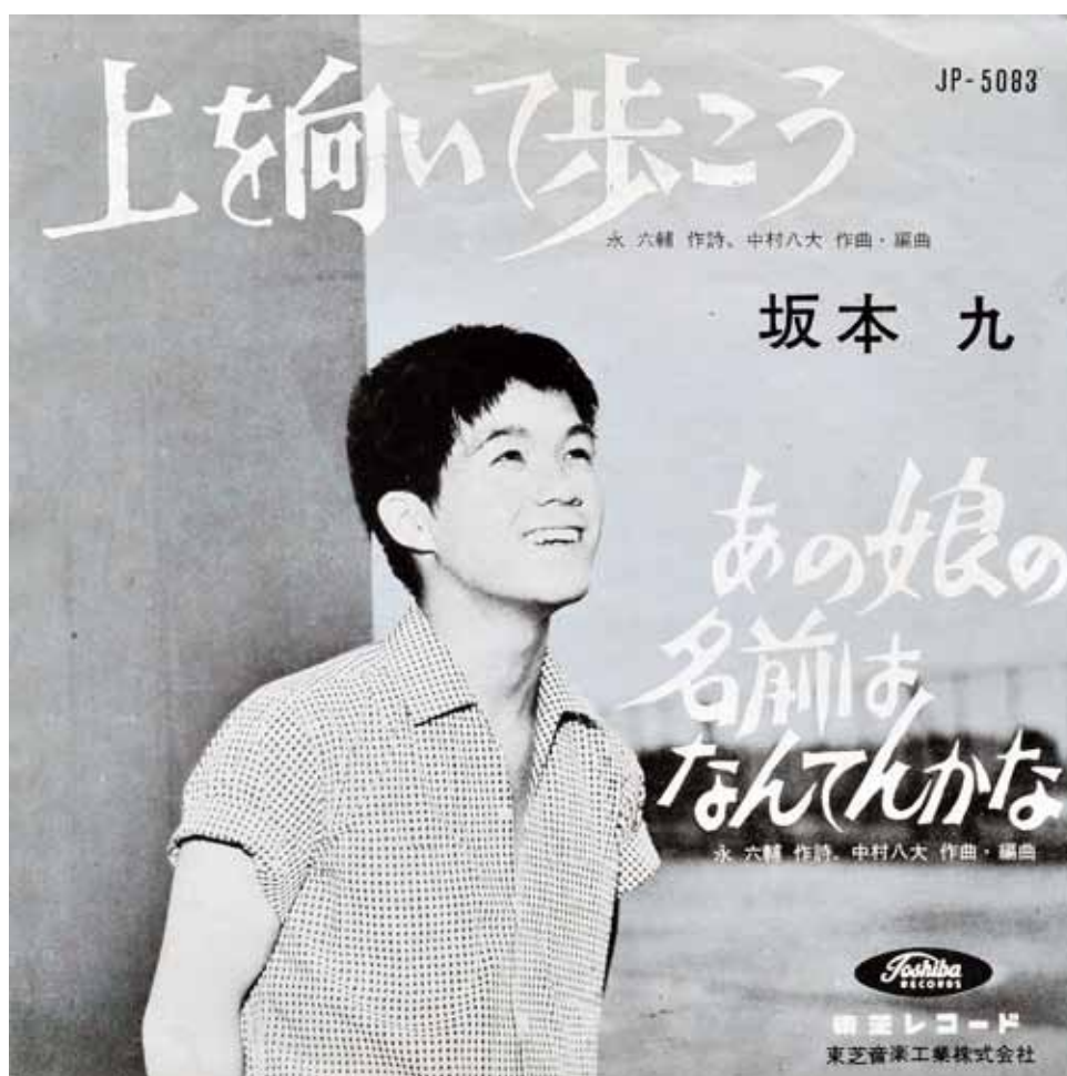
①「上を向いて歩こう」オリジナル盤ジャケット（発売／東芝レコード）