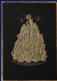
『吠月』(1917年 感情詩社・白日社)

朔太郎在詩集的序文中寫道：“詩既不神秘，也不具有象征意義，更不是鬼神。詩僅僅是擁有疼痛靈魂的人和孤獨的人在孤獨時的慰藉罷了”，他以敏銳纖細的感官，表達了孤獨感。